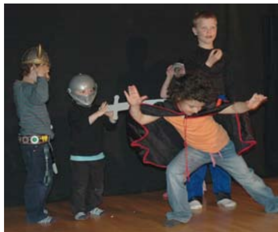
Familjedag med drama där alla, barn som vuxen, deltog utifrån sin egen kreativitet.