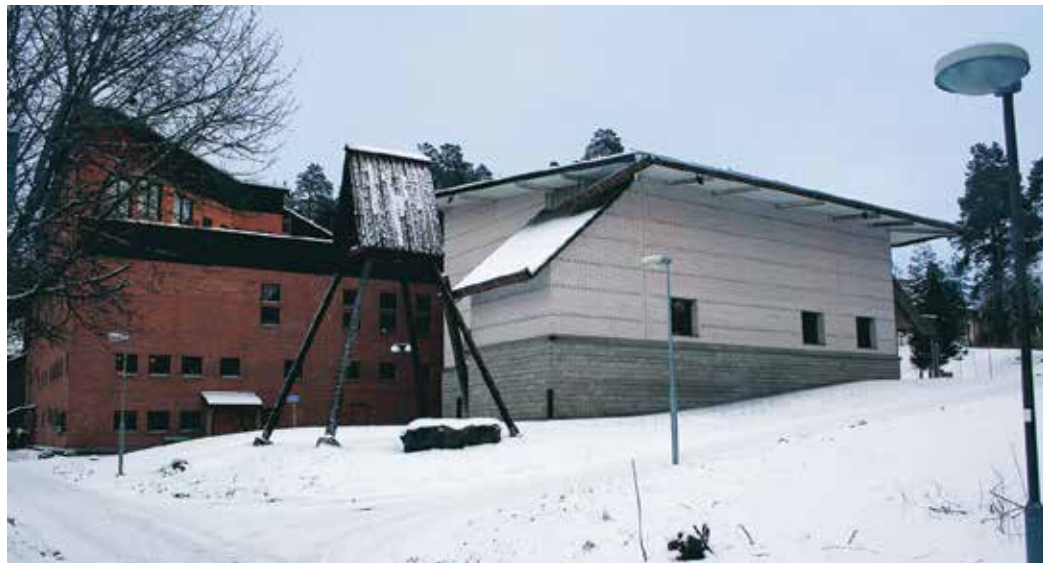
De två separata, men ihopplänkade byggnaderna, är varandras motsatser för att visa på deras olika funktioner.

Från den sobra och naturliga miljön i kyrkan kommer du sedan in i en färgkavalkad i församlingshuset. Allt verkar slumpvis målat, men följer ett strikt schema där det mesta har en djupare mening än vad det första intrycket ger. Till exempel kan du följa en diagonal genom hela huskroppen där ena sidans interiör är helt röd och den andra helt blå. De bärande väggarna är mörkare medan de tunnare väggarna